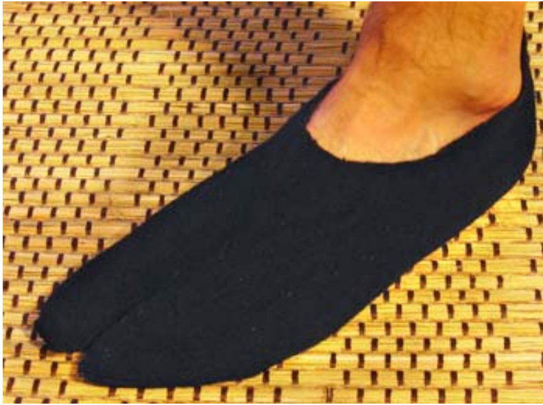
T v: Låga tabi i ull