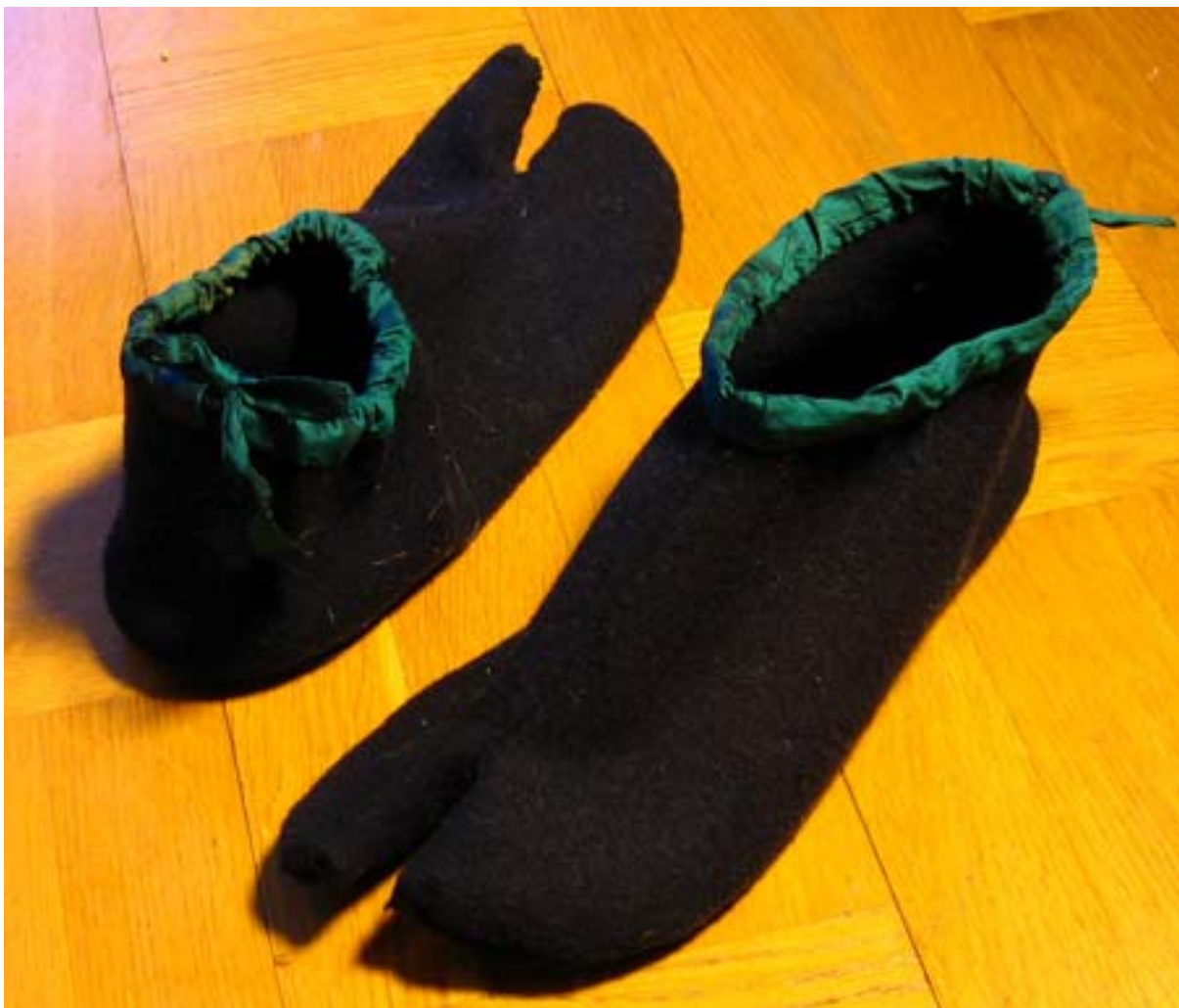
Ovan: Låga tabi i ull med kantband och snörning i dupionsilke. Sydda mer eller mindre exakt efter det mönster för låga tabi som visas i denna sömnadsbeskrivning.